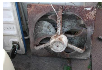
ファンの腐食が進行...