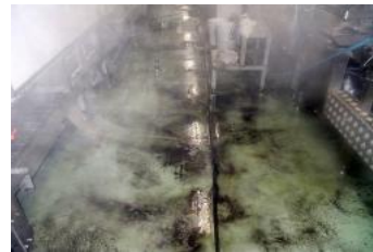
カビ・結露対策がしたい