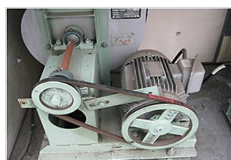
送風機モーターが古い