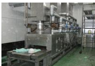
局所的に排気したい