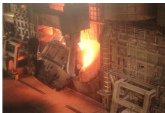
場内に熱がこもる