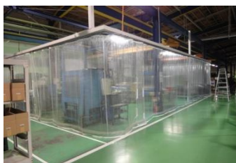
寒気と暖気を分けたい