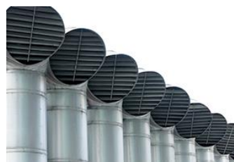
異音がする・うるさい