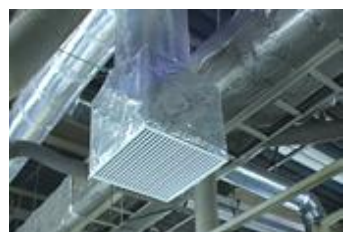
ファンを増設したい