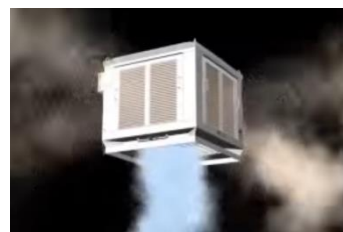
湿度を最適化したい